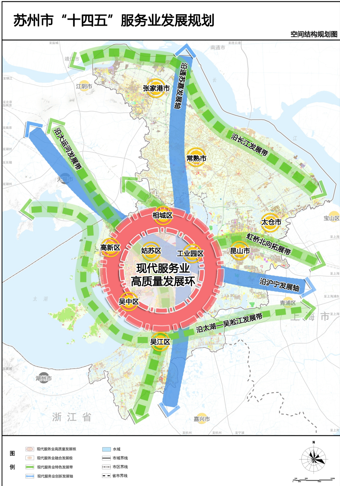
附图：苏州市“十四五”服务业发展空间结构规划图